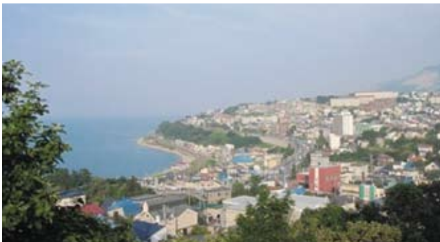
港と坂道、運河と歴史的建造物の街 小樽

※当日の交通状況により、予定時間が前後する場合がございます。復路交通は、時間に余裕をもってお手配ください。