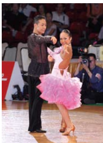
公益社団法人日本ダンススポーツ連盟・強化選手、ラテンS A級・スタンダードA級

幼少期より兄妹カップルとしてダンススポーツ競技開始。中学時代から全日本選手権・世界選手権等に出場し、優秀な成績を収める。現在、二人とも札幌国際大学2年。2012年、アジア選手権・世界選手権・ワールドカップ等の日本代表に選出される。