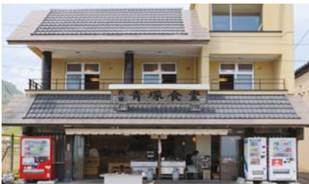
漁師直営店 青塚食堂

水揚げされた魚介を市場へ行く前に運ぶので、鮮度とリーズナブルさには自信がある。添乗員やタクシー運転手からもお墨付きの人気店です。