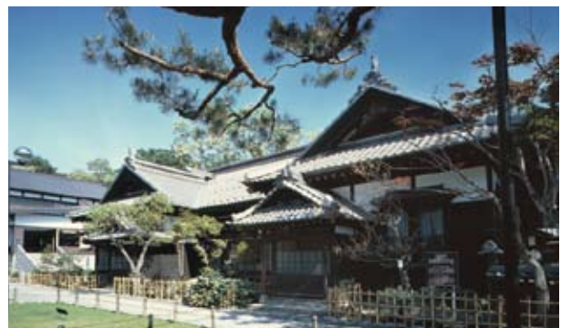
にしん御殿 小樽貴賓館(旧青山別邸 国登録有形文化財)