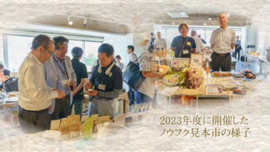
2023年度に開催したノウフク見本市の様子